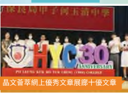
晶文薈萃網上優秀文章展廊十優文章