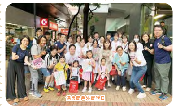
保良局戶外賣旗日