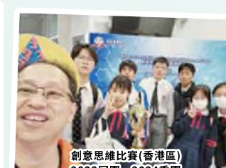
創意思維比賽(香港區) 2023冠軍、2024季軍