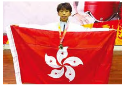
Thailand Taewondo Championship男子12-14歲 41公斤以下組別銀牌，第二十八屆 亞洲城市跆拳道錦標賽冠軍

本校積極培養學生，發掘具創意、領導及運動潛能的同學，讓同學在不同平台上發揮所長，展現才華。