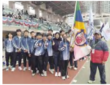
2023-2024保良局屬下中學 聯校運動會男子初級組團體亞軍， 另獲2冠3亞2季