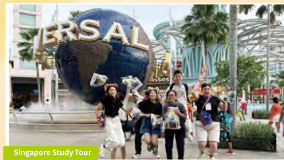
Singapore Study Tour

In order to allow our students to have more exposure to English, our school is dedicated to cultivating an English-rich environment. Throughout the year, the English Department has organized a wide range of fun-filled English activities catering to different interests. Students can showcase their talents in the annual Spelling Bee Competitions, put their culinary skills to the test in English baking classes, critically analyze films in movie appreciation sessions, and consolidate their grammar knowledge through interactive games. Reading is also emphasized across the curriculum, as we believe it is crucial to nurture students' English proficiency in all subjects. Beyond the campus, the English Department also encourages students to participate in various external English competitions like debates and writing contests, where students have consistently performed exceptionally well. By engaging students in English activities, our school aims to build their confidence and unlock their linguistic potential. Join us and embark on an exciting journey of English mastery!