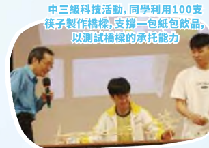
中三級科技活動，同學利用100支筷子製作橋樑，支撐一包紙包飲品，以測試橋樑的承托能力