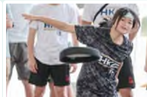
「主委盃」飛盤錦標賽躲避飛盤 公開組冠軍