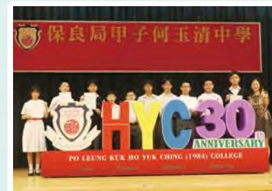
ICAS國際聯校學科評估及比賽 數學榮譽獎及科學榮譽獎