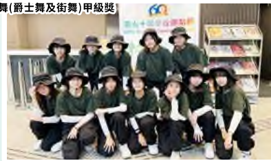
第六十屆學校舞蹈節中學組 群舞(爵士舞及街舞)甲級獎