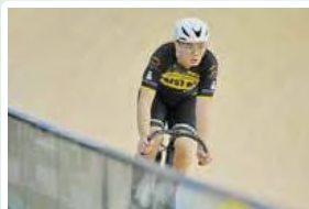
2023-24全港場地單車賽(第五回合) 250米個人計時賽男子學校組(甲組)冠軍 捕捉賽男子學校組(甲組)季军