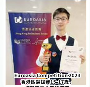
Euroasia Competition 2023 香港區選拔賽15-17歲， 鋼琴獨奏公開組 冠軍