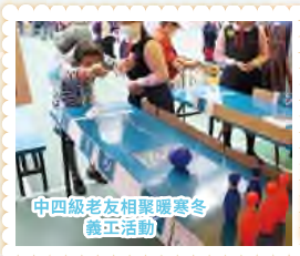
中四級老友相聚暖寒冬義工活動