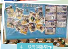
中一級青銅器製作