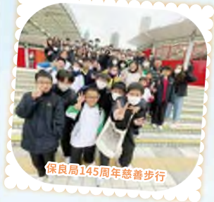
保良局145周年慈善步行