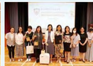
訓育輔導部獲邀在賽馬會幸福校園實踐計劃「幸福校園之旅」中作聯校分享，與教育界同工互相交流