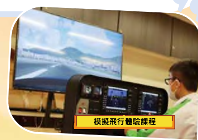
模擬飛行體驗課程