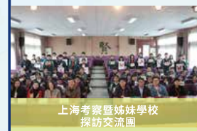
上海考察暨姊妹學校探訪交流團