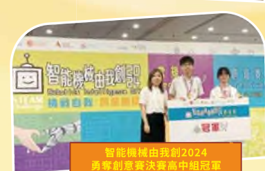
智能機械由我創2024 勇奪創意賽決賽高中組冠軍