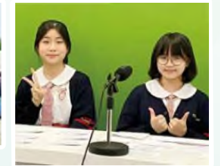
香港青年協會英語演講比賽初中組- 分區決賽傑出及優異表現獎