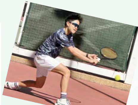
香港匹克球青少年公開賽2023單打冠軍和雙打亞軍 中國香港匹克球總會代表隊與肇慶市第一中學交流賽 男子團體冠軍及最佳球員-金獎