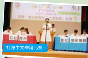
社際中文辯論比賽