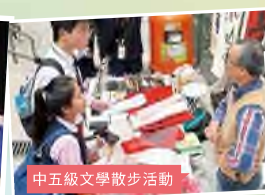
中五級文學散步活動