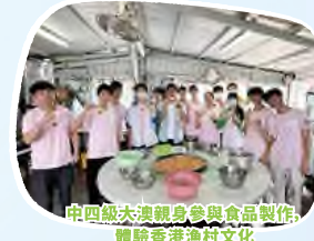
中四級大澳親身參與食品製作，體驗香港漁村文化