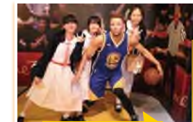
Visit to Madame Tussauds Hong Kong

本校採取多元化的策略，提升學生的英語水平，除新設科Social Issue in English外，輔以英語教授的科目包括數學、綜合科學、地理、歷史、物理、化學、生物、家政、電腦及體育。其中於家政、電腦、體育科，學生須學習中、英文詞彙，讓學生有更多機會浸淫在英語學習環境中，藉此加強英文的讀寫能力。