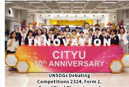
UNSDGs Debating Competitions 2324, Form 2, Grand Final Champion and the Best Speaker