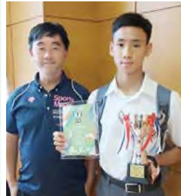
中銀香港卓越青苗運動員獎