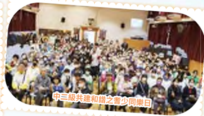
中三級共建和諧之青少年樂日