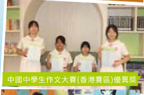
中國中學生作文大賽(香港賽區)優異獎