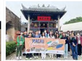
The winning contestant of SCMP Macau Unlocked: A Journey of Discovery for Students