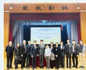
保良局西貢及港島區之屬校「校監和校董周年培訓計劃」分區校本培訓