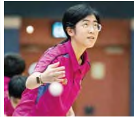
離島區分齡乒乓球比賽2023 女子青少年組單打(14-15歲)亞軍