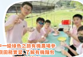
中一級綠色之旅有機農場參觀田務實習，了解有機麵包和再造紙製作