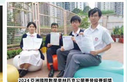
2024 亞洲國際數學奧林匹克公開賽晉級賽銅獎 2024 港澳數學奧林匹克公開賽「港澳盃」暨 亞洲國際數學奧林匹克公開賽初賽銅獎 第二十六屆香港青少年數學精英選拔賽三等獎