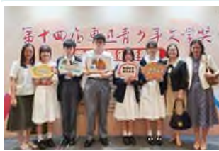
第十四屆魯迅青少年文學獎 初中寫作二等獎