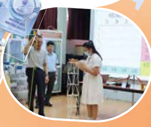
中二級科技活動: 利用100支飲管 製作高塔, 支撐一包紙包飲品, 以 測試高塔的承托能力及穩定性

配合長遠STEAM發展, 本校更增添新設施, 包括Indoor Hydroponic Farm(生物科室內水耕), Flight Simulator (模擬飛行體驗)及Vex IQ RobotFight (機械人比賽)設備。同學亦積極參與各項活動及比賽, 並在多項比賽中脫穎而出, 於創意思維世界賽香港區賽榮獲2023冠軍及2024季軍、Vex IQ RobotFight 2024 機械人比賽中勇奪高級組銀獎及初級組全場總冠軍和於智能機械由我創2024勇奪創意賽決賽高中組冠軍。