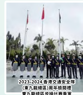
2023-2024 香港交通安全隊 (東九龍總區)周年檢閱禮 東九龍總區步操比賽季軍