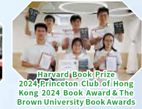
Harvard Book Prize 2024, Princeton Club of Hong Kong 2024 Book Award & The Brown University Book Awards