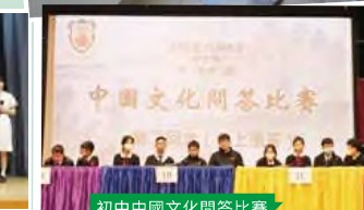
初中中國文化問答比賽