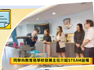
同學向教育局學校發展主任介紹STEAM設備