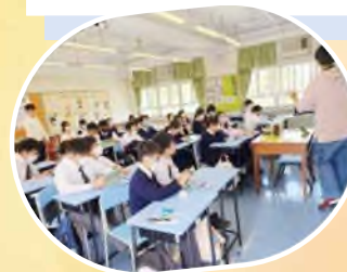
中一級Minecraft編程體驗工作坊

另外, 本校成功申請Enriched IT Programme in Secondary Schools「中學資訊科技增潤計劃」撥款, 培訓同學的創科技能。學校善用資源在課後及假期中舉辦不同的工作坊, 包括微軟人工智能基礎認證(AI900)培訓及考試預備班、以ML2Scratch平台體驗人工智能工作坊、用ObjectBlocks Arduino感應器自建IoT天文台 workshop、Python in Minecraft workshop及Minecraft編程體驗工作坊。本校更著力栽培同學, 推薦同學參加各項高階培訓, 如香港理工大學全港中小學STEM人工智能與大數據精英學習課程, Ideathon 三維建模workshop、專案管理及設計思維工作坊及大灣區「智」為未來科技體驗營2024, 讓同學了解新興的科技發展。