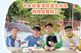
中三級香港非遺文化及博物館體驗日