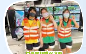
中三級輕鐵深度遊