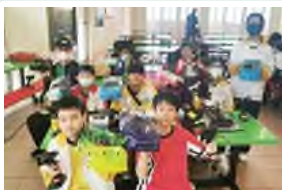
遙控模型車學界热身賽 初中組1亞1季 高中組1冠1季