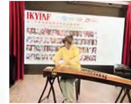
第十一屆香港國際表演藝術節 音樂大賽香港區初賽古箏 公開分齡組青年組第三名