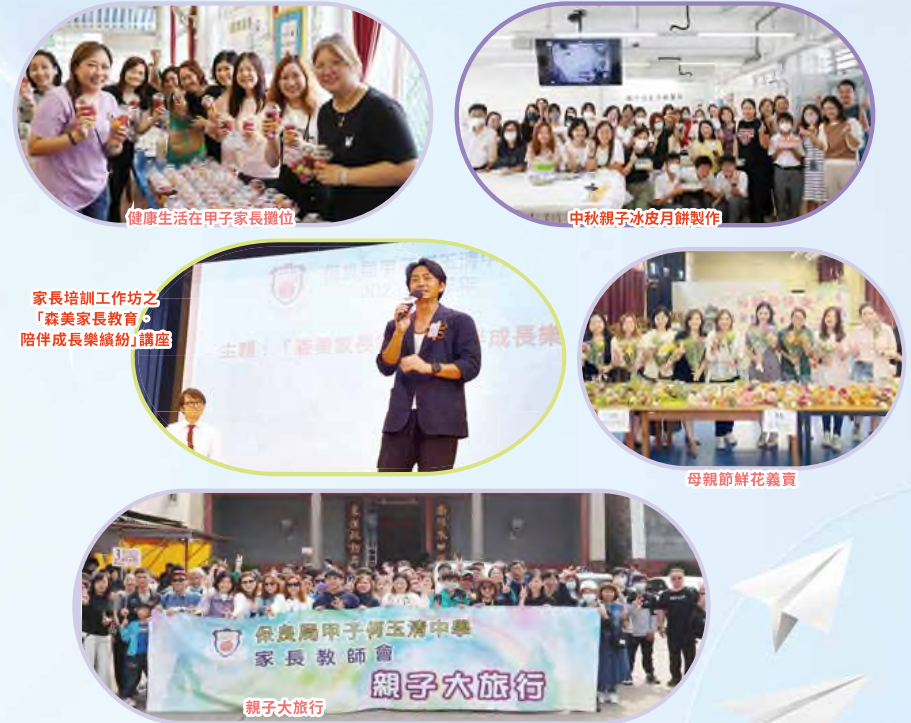
健康生活在甲子家長攤位

本校深信良好的家校合作能幫助同學愉快學習、健康成長。每年設三次家長日，維持家校良好溝通，家長教師會積極舉辦不同活動，實踐家校同行，包括參與人數超過二百人之親子旅行日、「森美家長教育·陪伴成長樂繽紛」講座及「健康生活在甲子」之健康攤位。