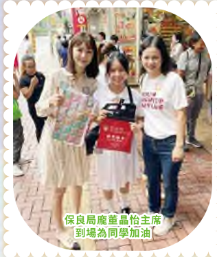
保良局龐董晶怡主席到場為同學加油

學校秉承「保赤安良、扶康育長」的宗旨，以關懷助人、自助的信念，培育學生為社會上有需要人士伸出援手，互相關愛的氛圍。學生積極服務，樂於助人。