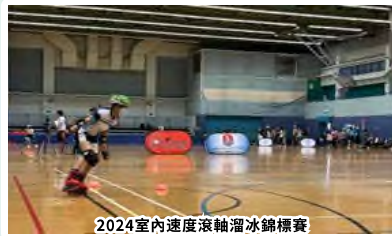
2024室內速度滾軸溜冰錦標賽 女子U14 休閒組五項第一名、 三項第二名及兩項第三名