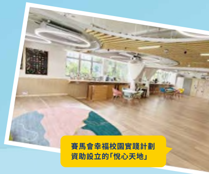
賽馬會幸福校園實踐計劃資助設立的「悅心天地」

本校資訊網絡及數碼直播系統覆蓋全校，全部課室均安裝電子白板。本校還特設甲子農莊、模擬駕駛機、生物科室內水耕、茶軒、數碼LED WALL、一間藏書三萬五千多冊的圖書館及十三間特別專室。其中更包括培養學生的創造、協作和解決問題的能力的STEM創客教室，以及由賽馬會幸福校園實踐計劃資助設立的「悅心天地」等。