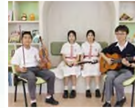
第七十六屆香港學校音樂節 銀獎及銅獎共5名