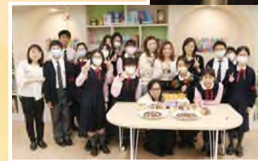
Charlie and the Chocolate Factory Reading Activity (Chocolate making & Book Sharing)