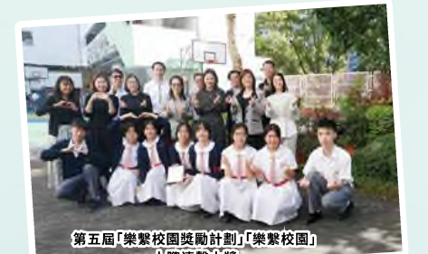
第五屆「樂繫校園獎勵計劃」 「樂繫校園」 人際連繫大獎 及連續十一年獲得「關愛校園」殊榮