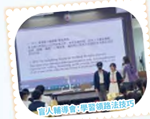
盲人輔導會：學習領路法技巧