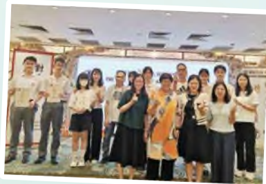
第18屆孝心徵文比賽「詮釋孝道： 我的故事」高中組優異獎及真情流露獎6名