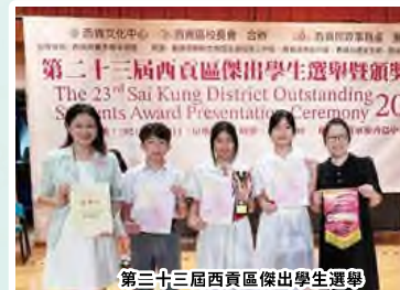
第三十三屆西貢區傑出學生選舉 「年度十大傑出學生」及「嘉許狀」