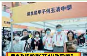
西貢及將軍澳STEAM教育網絡