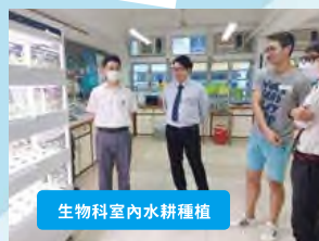
生物科室內水耕種植