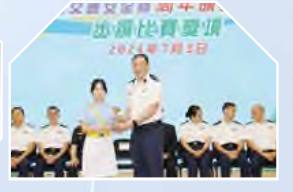
東九龍交通安全隊獎學金