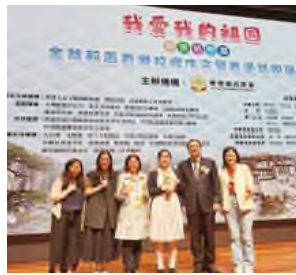
金紫荊盃香港校際作文暨普通話 朗誦大賽三等獎