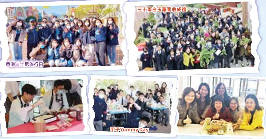
香港迪士尼旅行日

每年全校性的甲子活動，師生同樂、和諧融洽，維繫正向積極的師生關係，如全校香港迪士尼旅行日、「健康生活在甲子」。其中「甲子Yummy Day」中，全校同學充滿快樂和感恩共享由校長、老師、家長及學生代表所準備的美食，校園溫馨洋溢暖意。