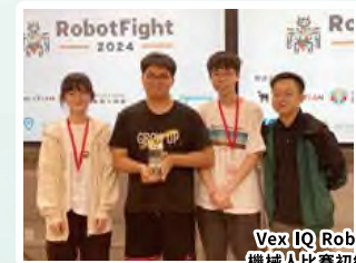
Vex IQ RobotFight 2024 機械人比賽初級組全場總冠軍