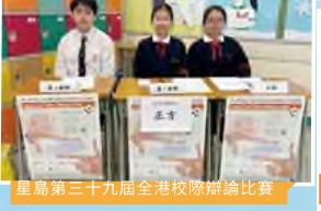
星島第三十九屆全港校際辯論比賽