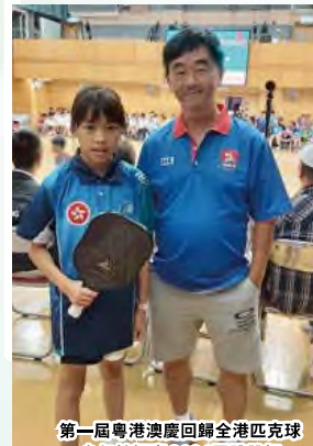
第一屆粵港澳慶回歸全港匹克球 少年錦標賽2024團體雙打 團體冠軍