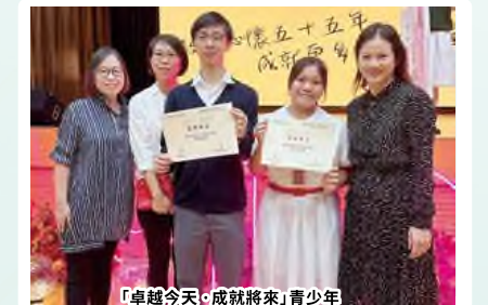
「卓越今天·成就將來」青少年 領袖獎勵計劃2023優秀學生及傑出學生