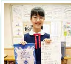
第75屆香港學校朗誦節2023 詩詞獨誦普通話冠軍 散文獨誦普通話亞軍