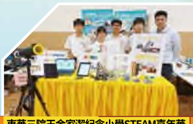
東華三院王余家潔紀念小學STEAM嘉年華