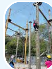
中二級團隊訓練日學生參與歷奇訓練，挑戰自我

各級團隊訓練日、訓練營、中三級環校跑及交通安全隊操練，訓練學生個人的自律性、獨立性及服從性。