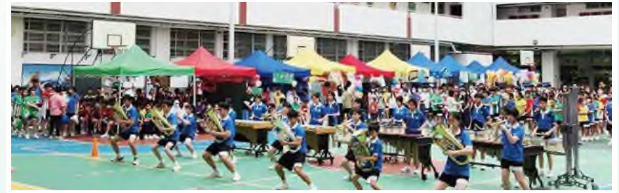
粵港澳大灣區音樂比賽敲擊樂組(廣東區)亞軍