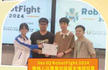
Vex IQ RobotFight 2024 機械人比賽獲初級組全場總冠軍