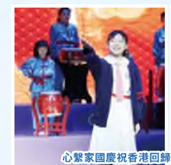
心繫家國慶祝香港回歸祖國27周年暨聯校國民教育活動匯演