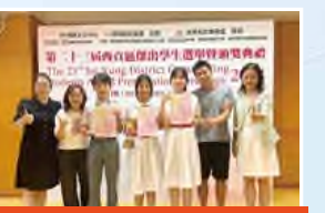
西貢區傑出學生選舉