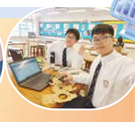
STEAM 培訓之ObjectBlocks Arduino感應器自建IoT天文台 workshop及Python in Minecraft workshop