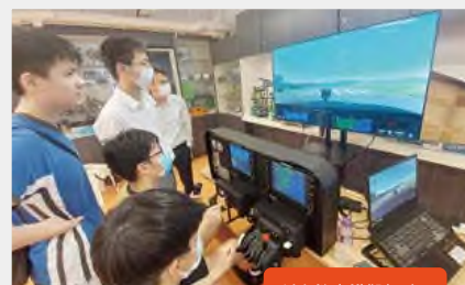
創客教室模擬駕駛器