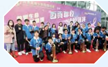
西貢聯校才藝匯演