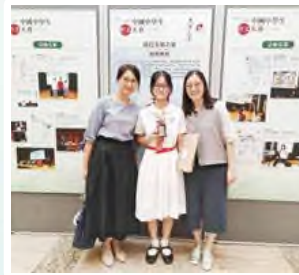
中國中學生作文大賽高中組銅獎