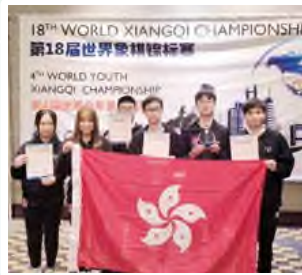
第四屆世界青少年象棋錦標賽 U16男子個人第五名