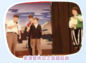
表演藝術日之英語話劇

各級團隊訓練日、訓練營、中三級環校跑及交通安全隊操練，訓練學生個人的自律性、獨立性及服從性。