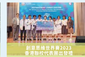
創意思維世界賽2023香港聯校代表團出發禮