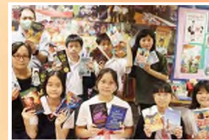
Bookworms Unite - Students tackle extensive reading challenges in the Battle of Books contest

UNSDGs Debating Competitions 2324, Form 2, Grand Final Champion and the Best Speaker