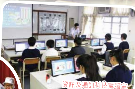
資訊及通訊科技電腦室