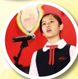
第 65 屆香港學校朗誦節中英文散文 及詩詞獨誦 3 季軍及 61 優良