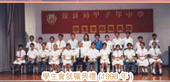
學生會就職典禮(1998年)