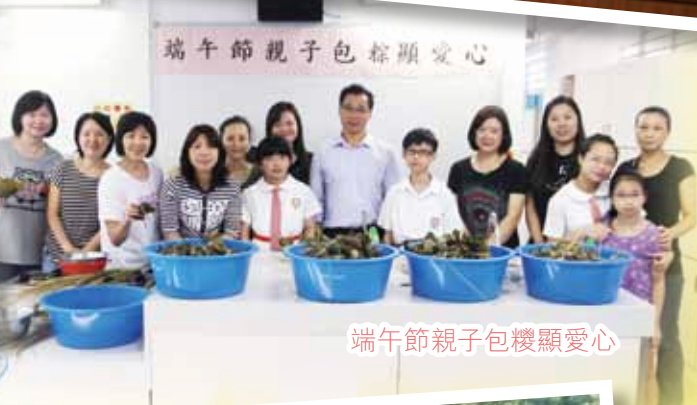
端午節親子包糉顯愛心