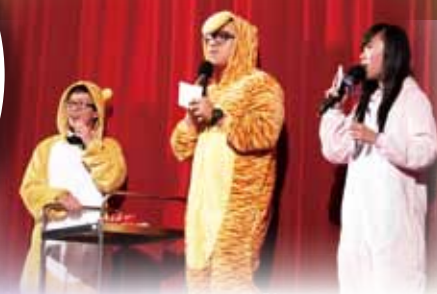
聖誕聯歡暨歌唱比賽