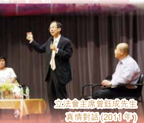
立法會主席曾鈺成先生 真情對話(2011年)