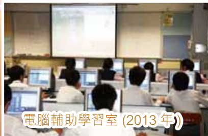
電腦輔助學習室 (2013年)