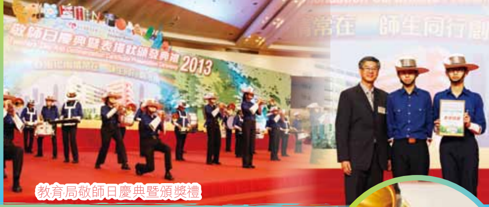
教育局敬師日慶典暨頒獎禮