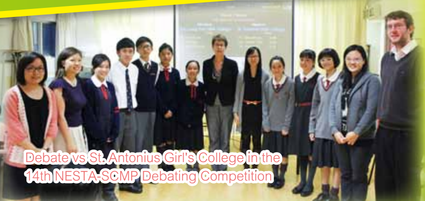
Debate vs St. Antonius Girl's College in the 14th NESTA-SCMP Debating Competition