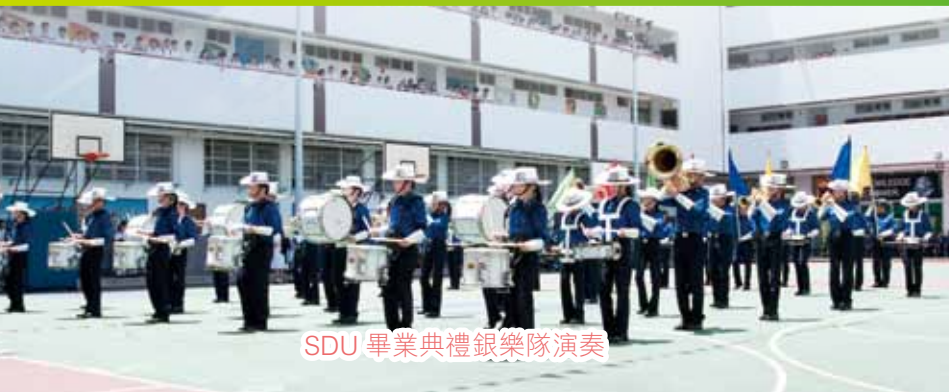
SDU 畢業典禮銀樂隊演奏