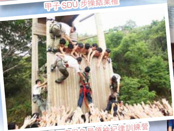
四日三夜保良局領袖紀律訓練營