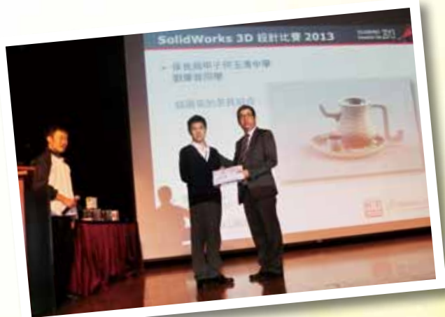
全港 Solidworks 3D 設計比賽囊括冠、亞、季軍及 Facebook 最受歡迎渲染圖獎