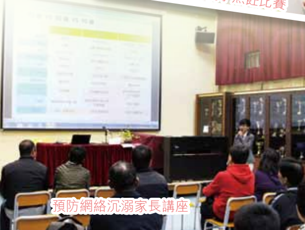
預防網絡沉溺家長講座