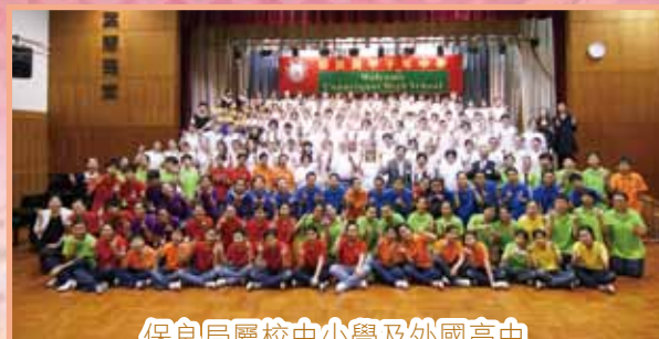
保良局屬校中小學及外國高中 交流匯演(2008年)

課程等，又主持學生小組活動。承蒙家長熱烈支持，本校曾連續十年榮獲家長也敬師運動之嘉許學校殊榮。家長教師會於二零一二年圓滿舉行首屆「法團校董會家長校董及替代家長校董選舉」。本校亦於二零一一年成立校友會，保持與歷屆校友之聯繫。