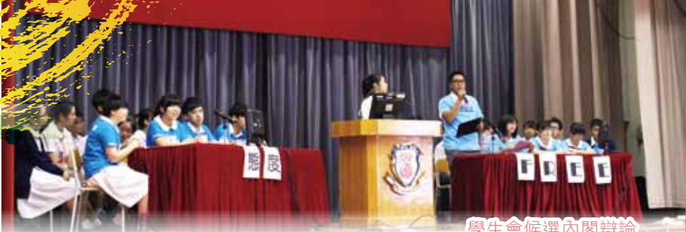
學生會候選內閣辯論

本年度學生會分別由候選內閣「FREE」和候選內閣「態度」進行競選。兩個內閣進行了一輪激戰後，「FREE」於全校學生投票下成功當選。當選後的「FREE」致力服務學生，積極舉辦多項比賽和活動，吸引全校師生參與，共渡愉快的學年。