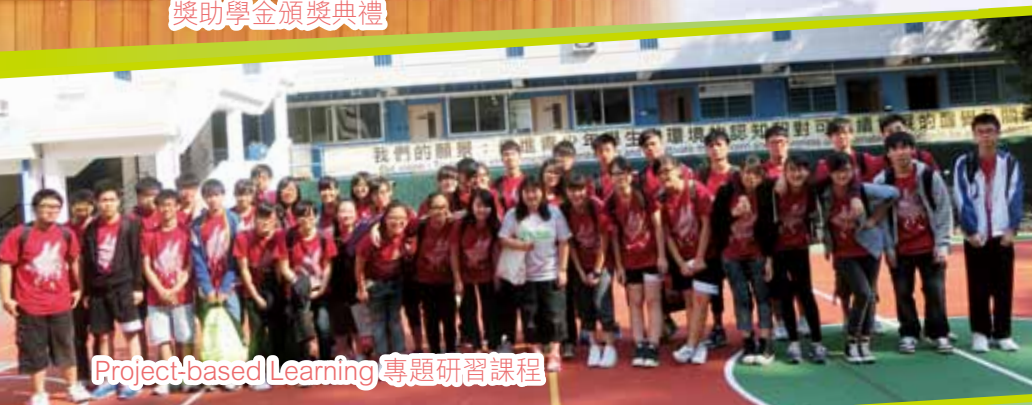
Project-based Learning 專題研習課程