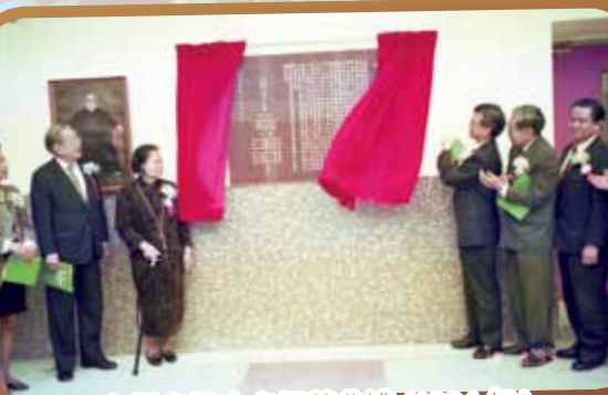
方樹泉樓命名揭幕典禮(1994年)