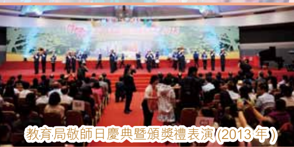
教育局敬師日慶典暨頒獎禮表演(2013年)