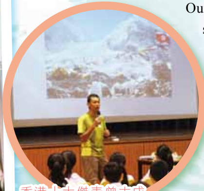
香港十大傑青曾志成先生分享登上世界第一高峰——珠穆朗瑪峰的經歷

An award scheme has been introduced to encourage excellent performance in conduct, study, services and activities.