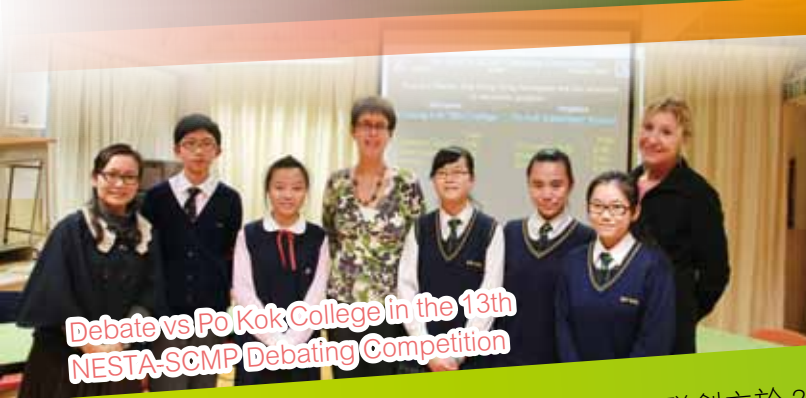
Debate vs Po Kok College in the 13th NESTA-SCMP Debating Competition