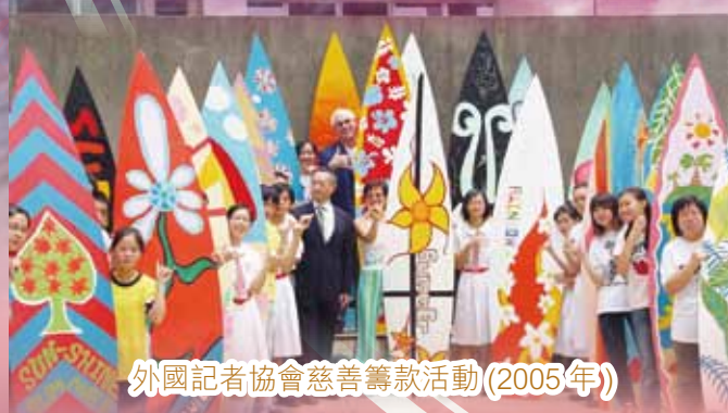
外國記者協會慈善籌款活動(2005年)