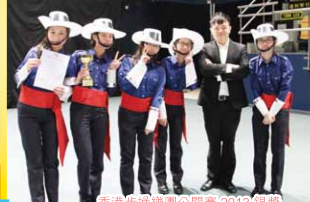
香港步操樂團公開賽 2013 銀獎