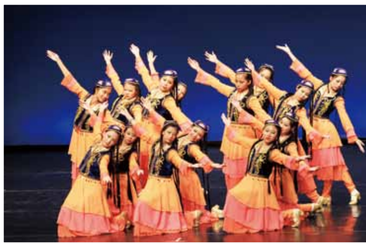
第 41 屆全港公開舞蹈比賽中國舞 (群舞) 銅獎