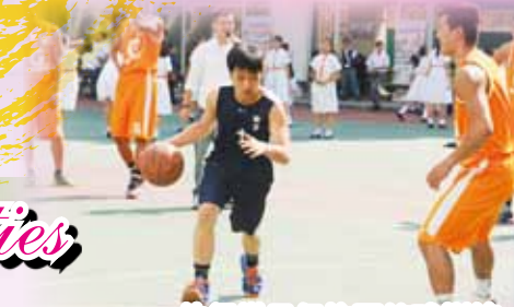
佳得樂星級校園籃球訓練

In order to achieve all round development, our school requires all students to take part in co-curricular activities. There are four Houses and more than 50 activity groups, which can be categorized into academic associations, interest clubs, uniformed groups, service teams, sports teams, and art and performance groups. Operation of these clubs and co-curricular activities is continued even in holidays. Furthermore, trained and experienced student committees assist teachers to plan and organize activities.