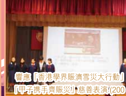
響應「香港學界賑濟雪災大行動」 『甲子携手齊賑災』 慈善表演(2003年)