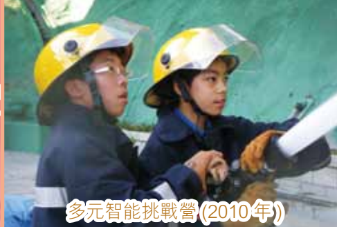
多元智能挑戰營(2010年)