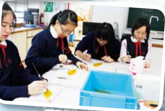
科學學會葉墨書籤

As we treasure learning with pleasure, we employ a variety of methods to suit the requirements of different subjects and students while seasoning learning with activities. We promote extensive reading through the award schemes, with ceaseless acquisitions of books and reading facilities. We provide abundant tuition sessions after school and adopt a continuous and spiral method in academic assessments.