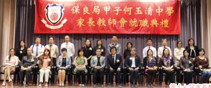
第十七屆家長教師會就職典禮