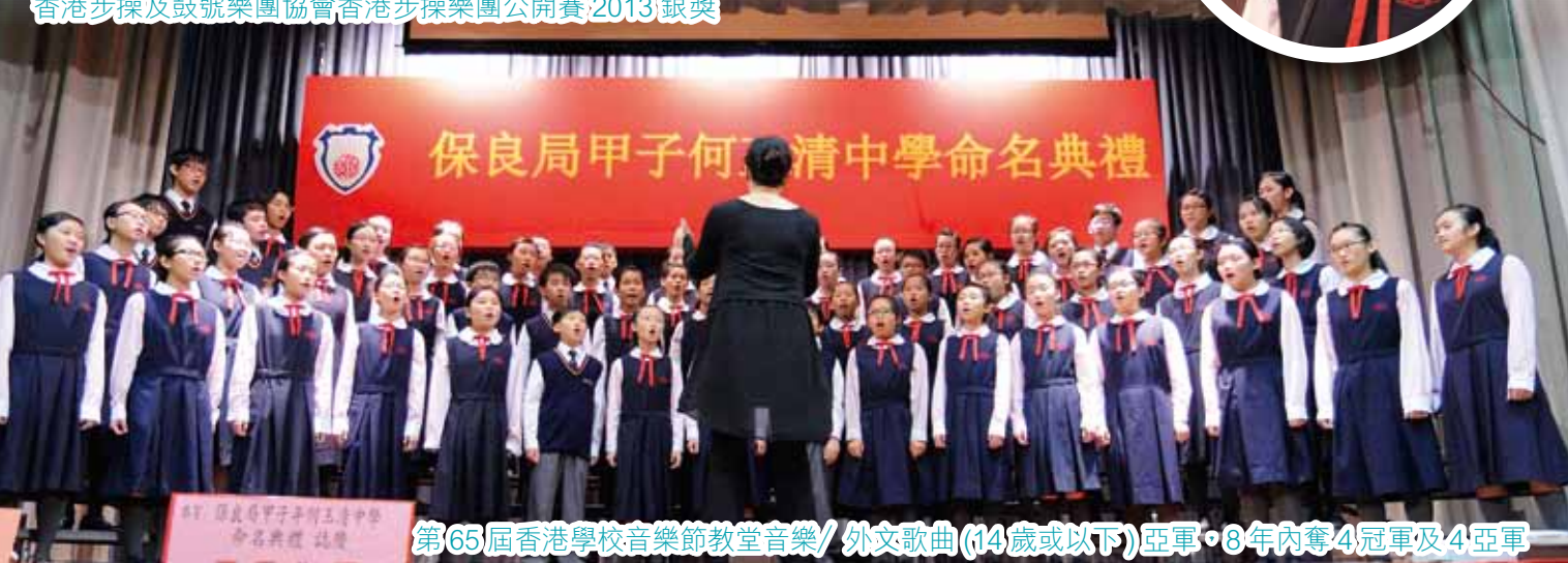
第 65 屆香港學校音樂節教堂音樂/ 外文歌曲 (14 歲或以下) 亞軍 • 8 年內奪 4 冠軍及 4 亞軍