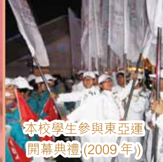
本校學生參與東亞運 開幕典禮(2009年)