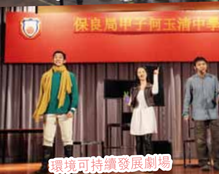
環境可持續發展劇場