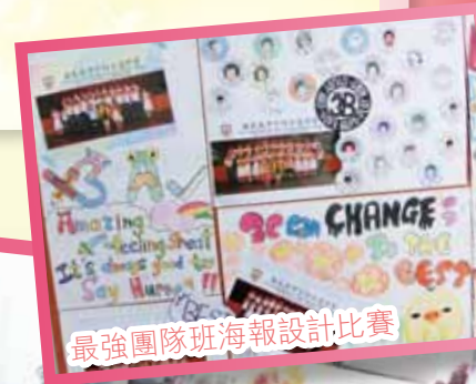
最強團隊班海報設計比賽