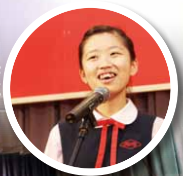
星島第 29 屆全港校際 辯論比賽「最佳交互 答問辯論員」獎