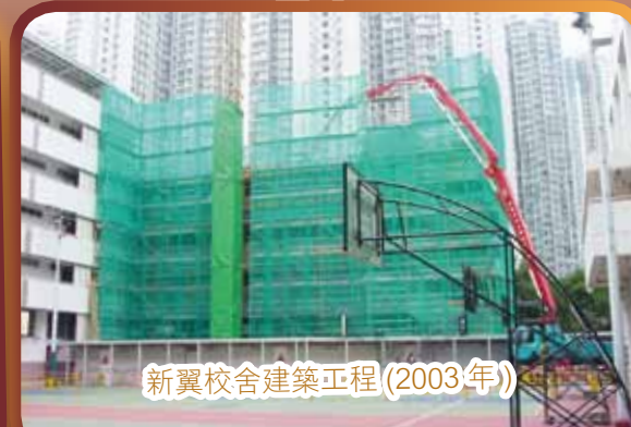
新翼校舍建築工程(2003年)