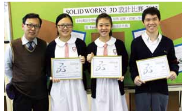
全港 Solidworks 3D 設計比賽囊括冠、亞、 季軍及 Facebook 最受歡迎渲染圖獎