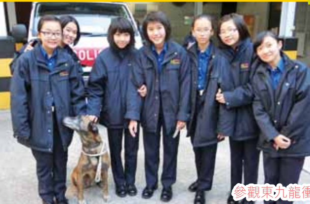
參觀東九龍衝鋒隊行動基地