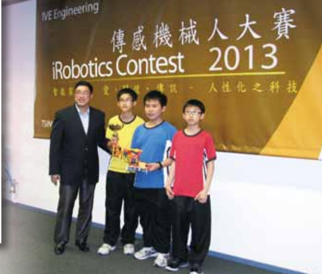
香港專業教育學院青衣分校暨機械人數碼發展中心 「2013 傳感機械人比賽」季軍、夏季嘉年華 2013 比賽 亞軍、全港學界遙控車賽 2014 獲獎個人賽初級 C 組亞軍