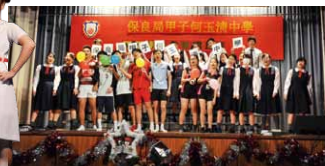
聖誕聯歡暨歌唱比賽