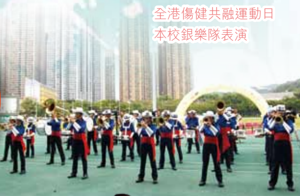
全港傷健共融運動日 本校銀樂隊表演