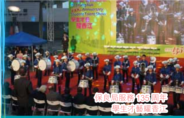
保良局服務 135 週年 學生才藝耀香江