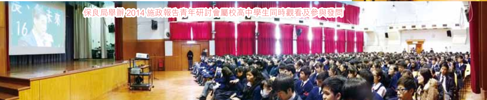
保良局舉辦2014施政報告青年研討會屬校高中學生同時觀看及參與發問