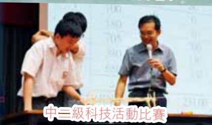
中三級科技活動比賽