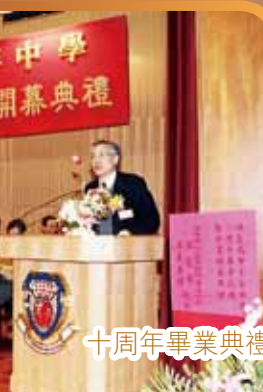
十周年畢業典禮暨新翼開幕典禮 (2003年)