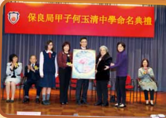
保良局甲子何玉清中學命名典禮