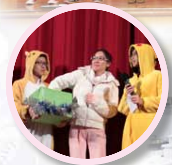
聖誕聯歡暨歌唱比賽 家長教師會幹事現場抽獎