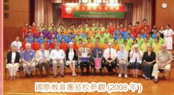
國際教育團蒞校參觀(2008年)