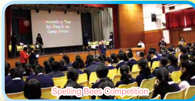
Spelling Bees Competition