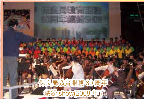
保良局教育服務60周年 繽紛show(2008年)