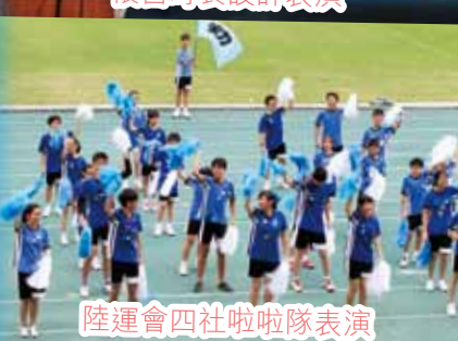
陸運會四社啦啦隊表演