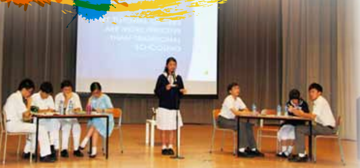
第一屆「Flashpoint Debating」英語辯論比賽亞軍