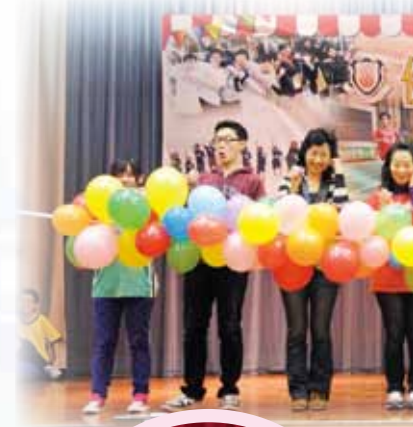
「萬朵鮮花，萬分敬意」 義賣鮮花活動

Our school cherishes the close partnership with the parents. The Parent-Teacher Association was set up in 1997. Parents have participated in many school functions, donated prizes in various occasions, held interest groups for our students after school and attended parents' training sessions. To promoting the participation of parent in school management and decision-making, the 3rd election of parent managers of The Incorporated Management Committee (IMC) has been conducted by PTA in 2014. Under the enthusiastic support from parents, one parent manager and an alternate parent manager have been elected.