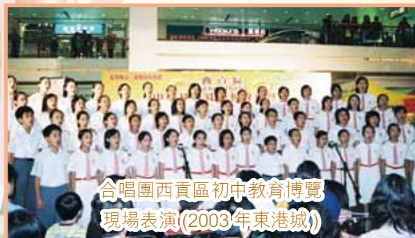
合唱團西貢區初中教育博覽 現場表演(2003年東港城)