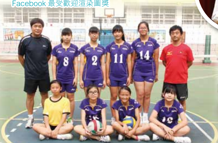
中學校際排球比賽第三組 (九龍) 女子丙組季軍