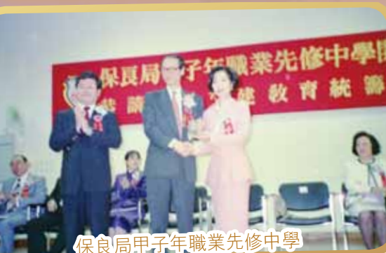
保良局甲子年職業先修中學 開幕典禮(1994年)