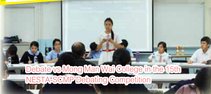
Debate vs Mong Man Wai College in the 15th NESTA-SCMP Debating Competition