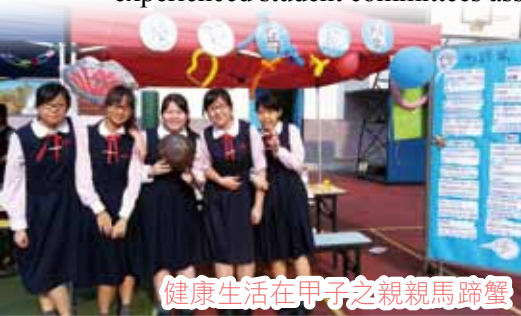
健康生活在甲子之親親馬蹄蟹