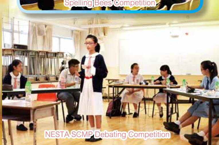
NESTA SCMP Debating Competition