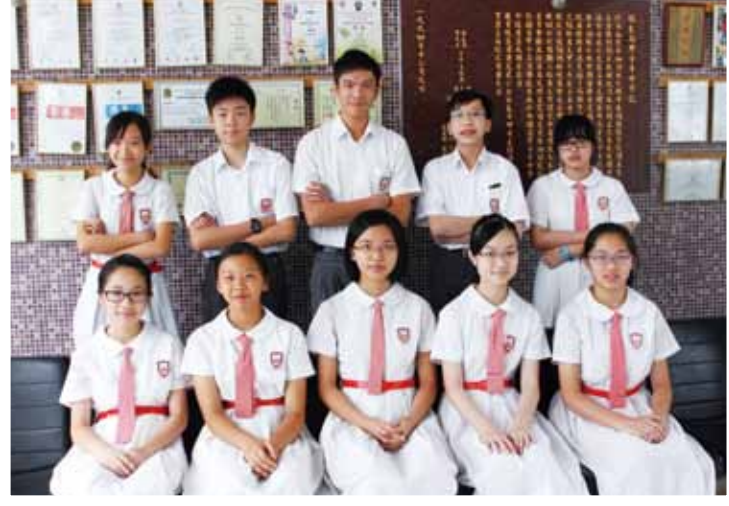
2013 澳洲新南威爾斯大學「國際聯校學科評估」 優異獎 6 名、優良獎 9 名。