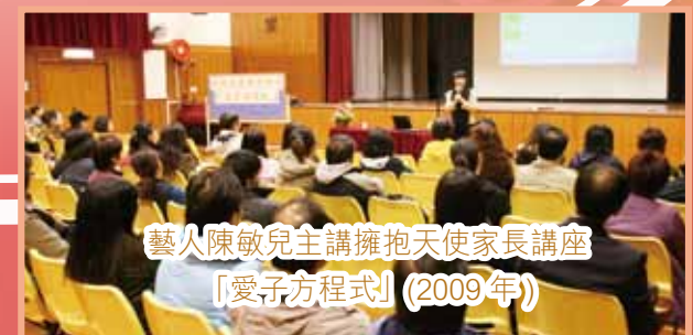
藝人陳敏兒主講擁抱天使家長講座 「愛子方程式」(2009年)