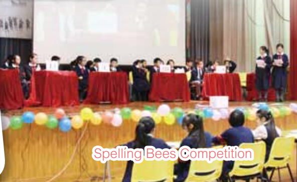
Spelling Bees Competition