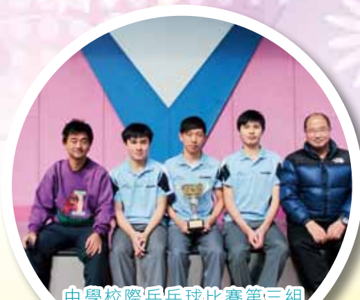
中學校際乒乓球比賽第三組 (九龍三區) 男子甲組冠軍、 丙組亞軍及團體冠軍