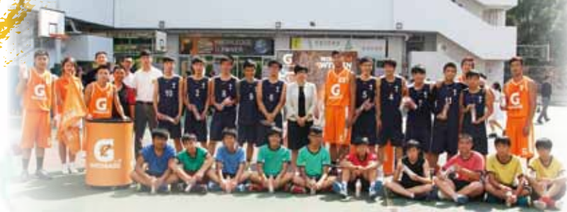
佳得樂星級校園籃球訓練