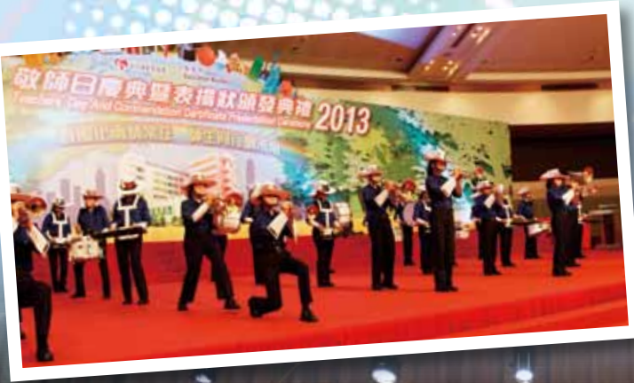
香港步操及鼓號樂團協會香港步操樂團公開賽 2013 銀獎