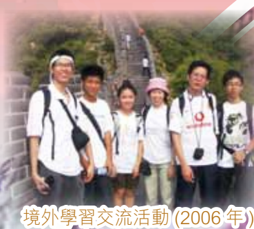
境外學習交流活動(2006年)