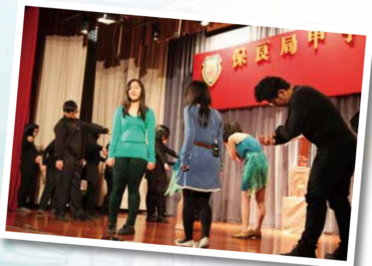
Hong Kong School Drama Festival 2012/13 Secondary English Category Award for Outstanding Director, Award for Outstanding Script & Award for Outstanding Performer