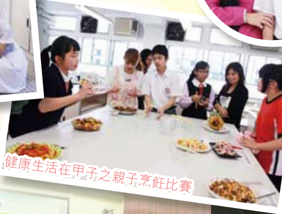
健康生活在甲子之親子烹飪比賽