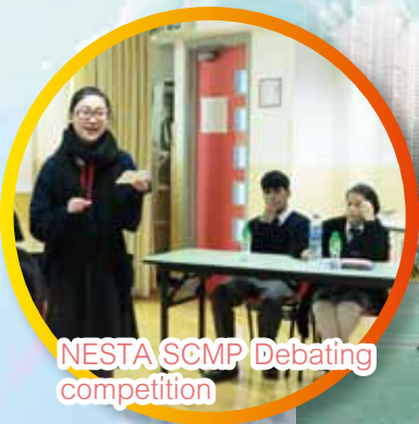
NESTA SCMP Debating competition