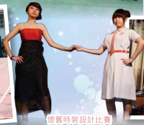
懷舊時裝設計比賽