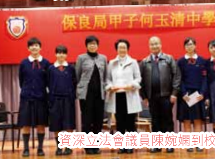
資深立法會議員陳婉嫻到校與本校學生討論識香港的勞工議題