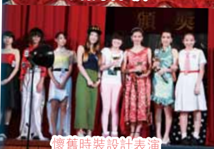
懷舊時裝設計表演