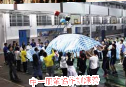
中一朋輩協作訓練營