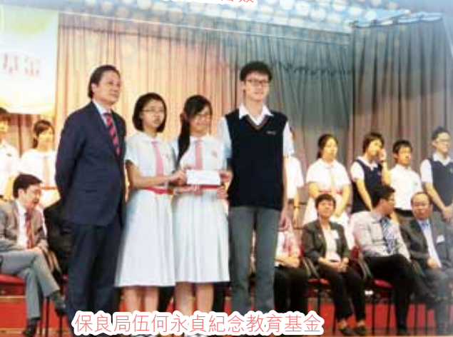
保良局伍何永貞紀念教育基金 獎助學金頒獎典禮