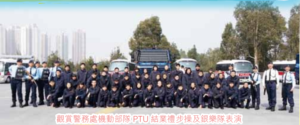
觀賞警務處機動部隊 PTU 結業禮步操及銀樂隊表演