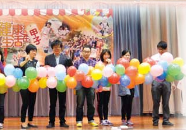
健康生活在甲子親子同樂日