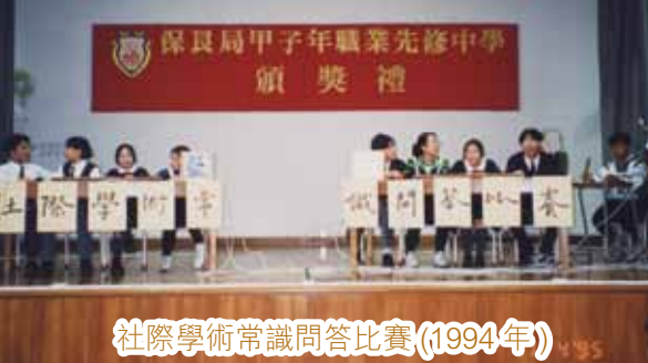
社際學術常識問答比賽(1994年)