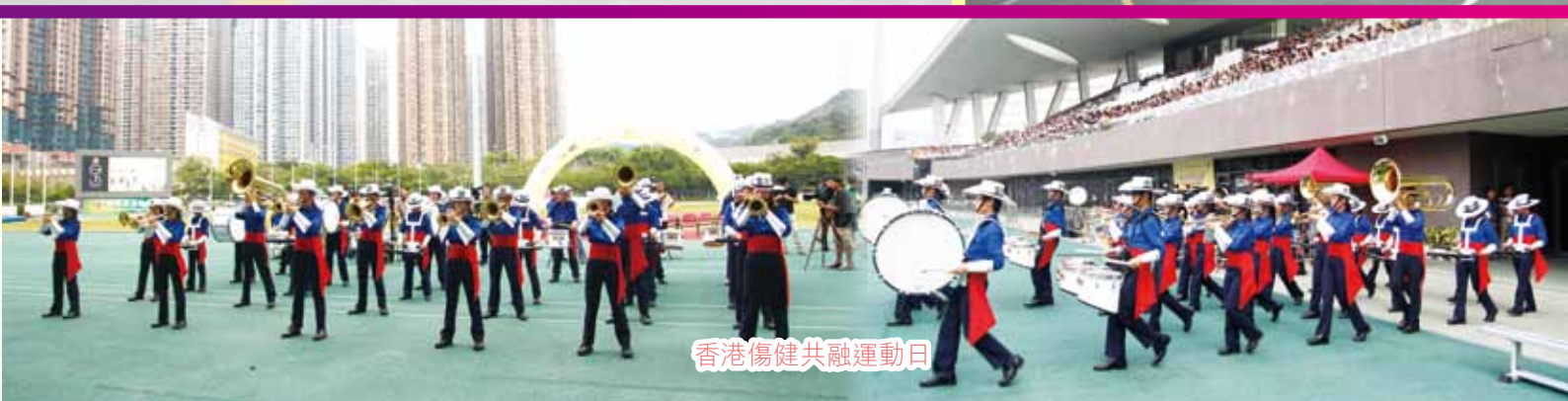
香港傷健共融運動日