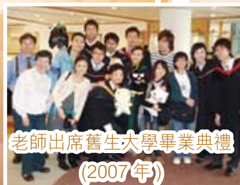
老師出席舊生大學畢業典禮 (2007年)