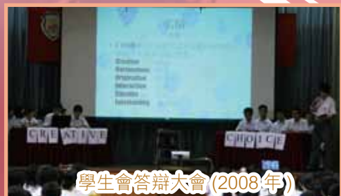
學生會答辯大會(2008年)