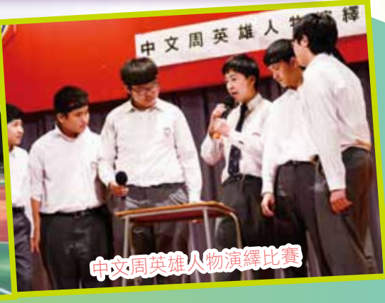
中文周英雄人物演繹比賽