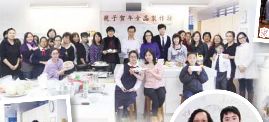
親子賀年食品製作坊