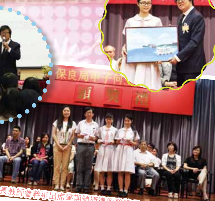
家長教師會幹事出席學期頒獎禮頒發獎項