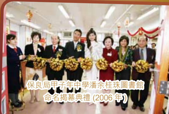
保良局甲子年中學潘余桂珠圖書館 命名揭幕典禮 (2006年)