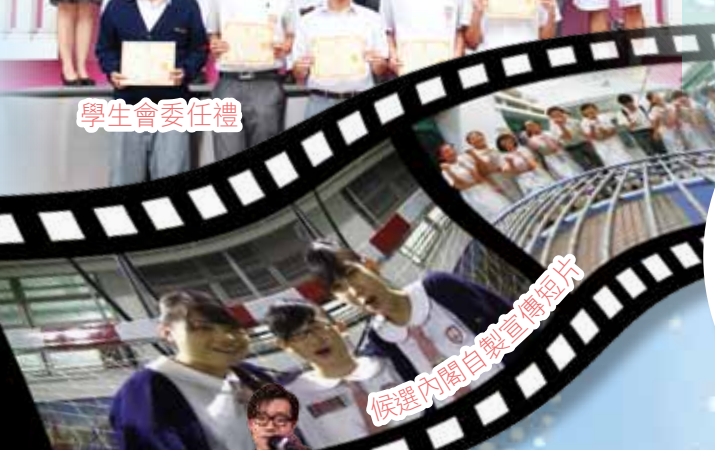
候選內閣自製宣傳短片