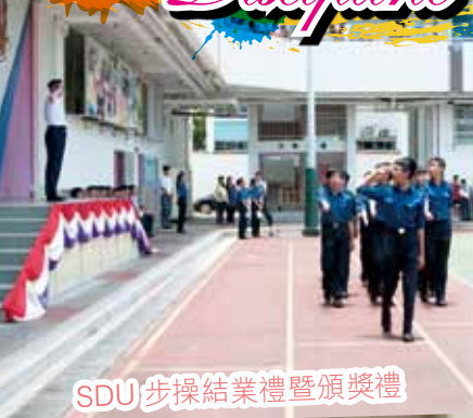
SDU步操結業禮暨頒獎禮