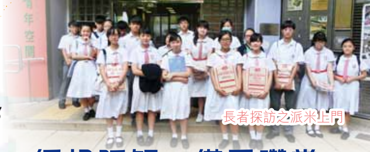
長者探訪之派米上門