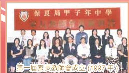
第一屆家長教師會成立(1997年)

本校著重全人教育，多元發展。全校學科及體藝學會超過五十個，如中英文辯論隊、機械人學會及甲子服務團。中一至中五級均設有全方位學習日，還有各級紀律訓練活動，如中三及中五全級境外學習交流團，高中另有保良局領袖紀律訓練營及營後跟進日。本校創立的制服隊伍，如領行者(SDU)及銀樂隊表現出色，初中合唱團、中英文朗誦隊及體育隊伍，校外均屢獲殊榮。在積極推動生命教育下，本校更連續兩年榮獲全港「關愛校園」榮譽。近年本校更推動健康生活，綠色人生，每年校內均舉行「健康生活在甲子」的社區活動，向學生及區內街坊宣揚健康生活。學生會由全體學生投票選出，除了舉辦不同類型的活動外，更定時向校方反映學生意見，良好的溝通令學校更臻完善。