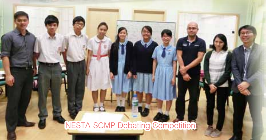
NESTA-SCMP Debating Competition