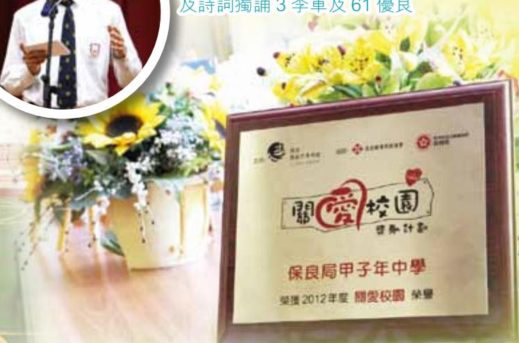
連續兩年榮獲香港基督教服務處 「關愛校園獎勵計劃 BLESS」比賽「關愛校園」榮譽