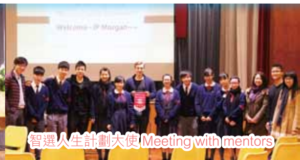
智選人生計劃大使 Meeting with mentors