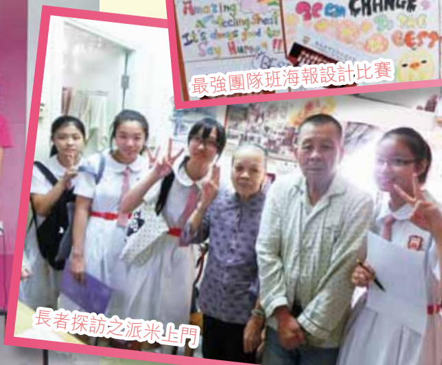
長者探訪之派米上門