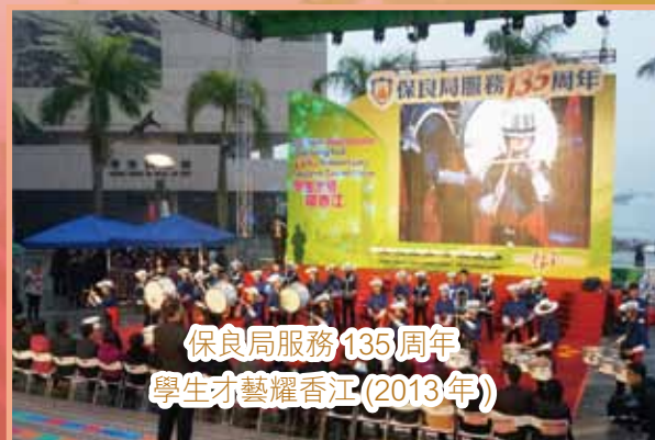
保良局服務135周年 學生才藝耀香江(2013年)