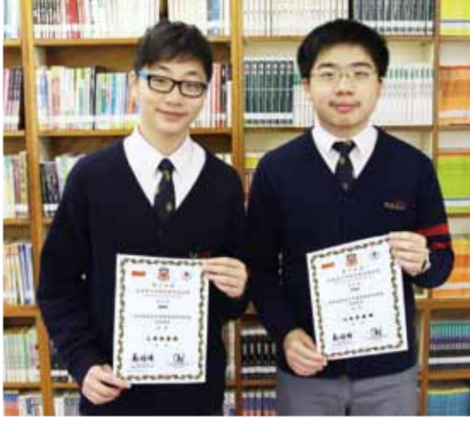
第十五屆香港青少年數學精英選拔賽 三等榮譽獎 2 名