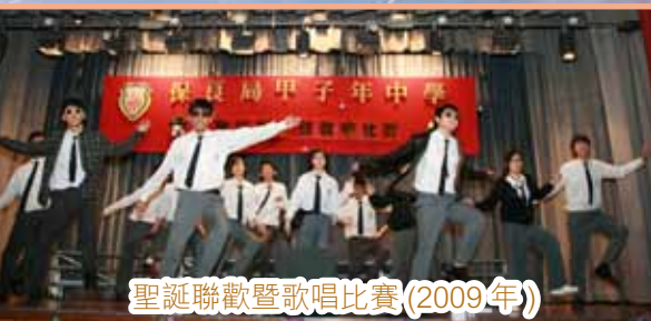
聖誕聯歡暨歌唱比賽(2009年)