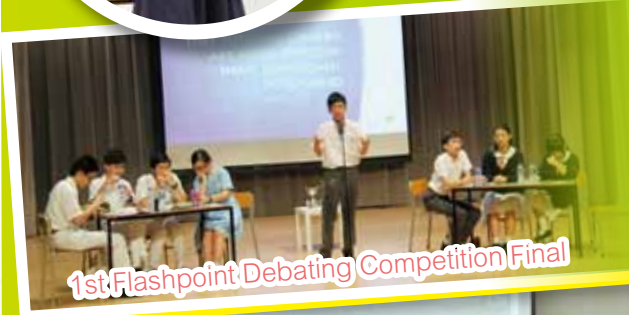
1st Flashpoint Debating Competition Final