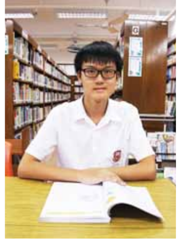
2013 希望杯國際數學競賽 中學組三等獎