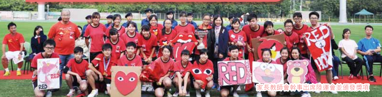
家長教師會幹事出席陸運會並頒發獎項