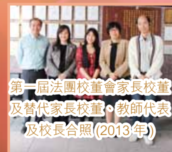
第一屆法團校董會家長校董 及替代家長校董、教師代表 及校長合照(2013年)