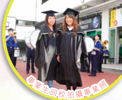
畢業生回校拍攝畢業照

本校秉承保良局優良之辦學傳統，以學生為本，提供多元化課程，培育學生獨立思考及創意，發掘其興趣及潛能，並建立自尊、自信及愛人如己之素質，讓莘莘學子在德、智、體、羣、美、靈各方面獲得全面發展，以貢獻社會及國家。