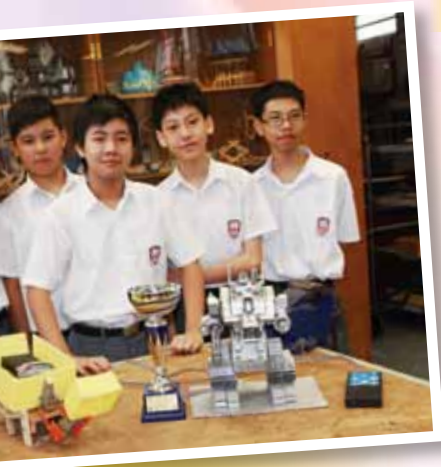
第14屆香港機械奧運會2012中學陸上機械人組冠軍