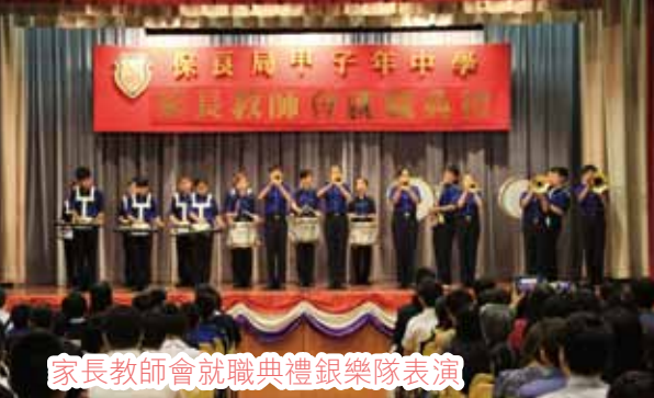
家長教師會就職典禮銀樂隊表演