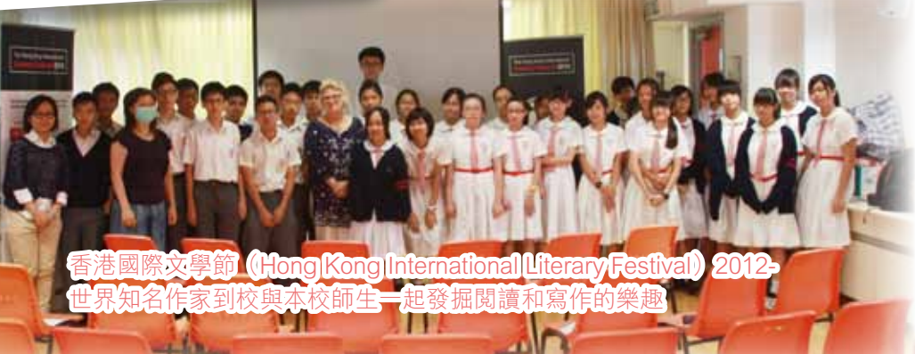
香港國際文學節 (Hong Kong International Literary Festival) 2012- 世界知名作家到校與本校師生一起發掘閱讀和寫作的樂趣