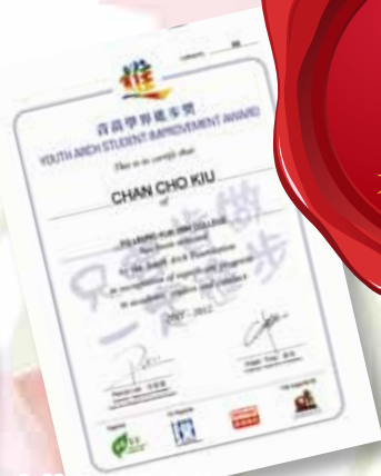
青苗學界進步獎 2011-2012 進步獎 26 名