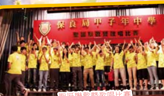
聖誕聯歡暨歌唱比賽