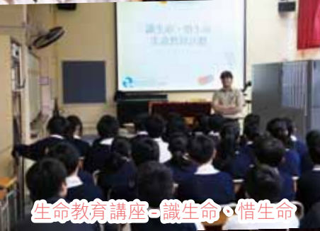
生命教育講座 - 識生命、惜生命