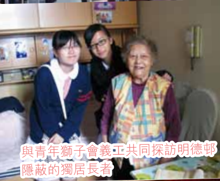
與青年獅子會義工共同探訪明德邨 隱蔽的獨居長者