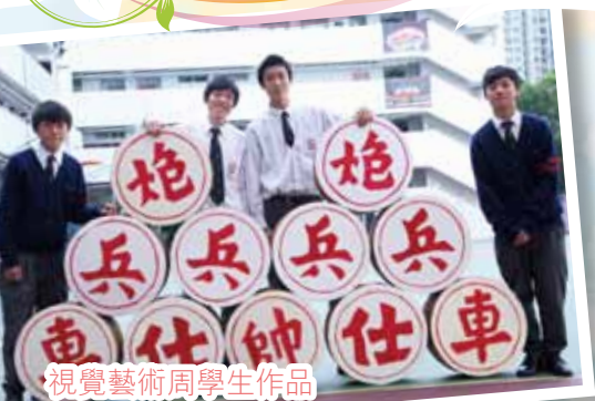
視覺藝術周學生作品

As we treasure learning with pleasure, we employ a variety of methods to suit the requirements of different subjects and students while seasoning learning with activities. We promote extensive reading through the award schemes, with ceaseless acquisitions of books and reading facilities. We provide abundant tuition sessions after school and adopt a continuous and spiral method in academic assessments.