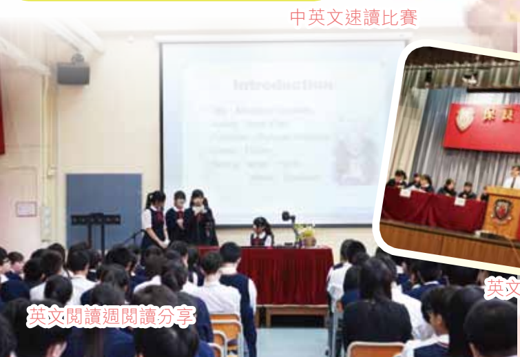
英文串字比賽 Spelling Bee