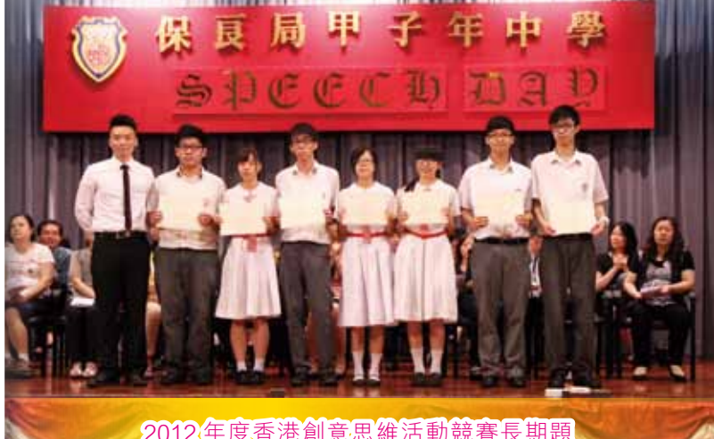
2012年度香港創意思維活動競賽長期題《由你做主!》第三組別季軍