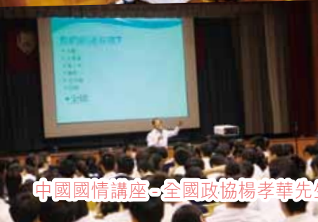
中國國情講座 - 全國政協楊孝華先生