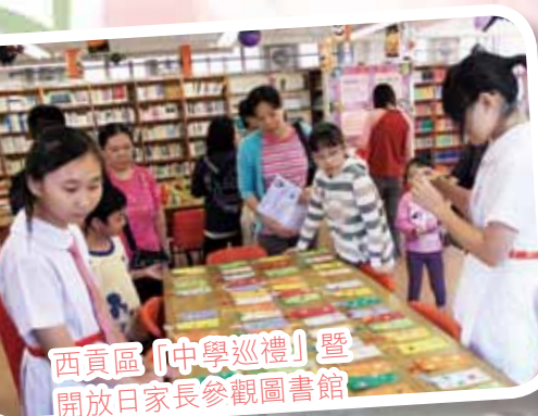
西貢區「中學巡禮」暨 開放日家長參觀圖書館