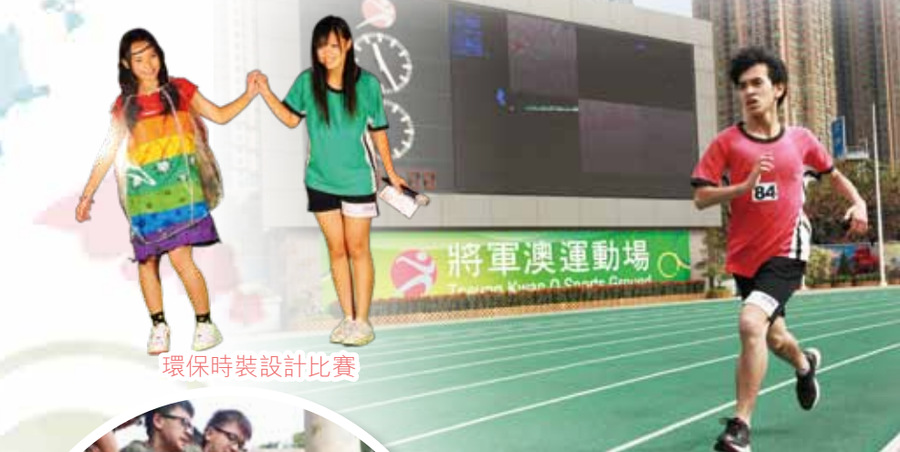
環保時裝設計比賽