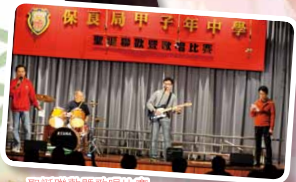
聖誕聯歡暨歌唱比賽