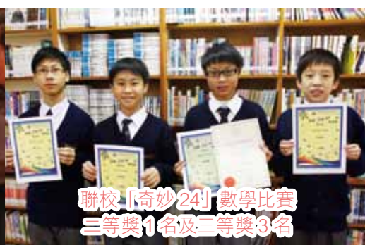
聯校「奇妙24」數學比賽三等獎1名及三等獎3名