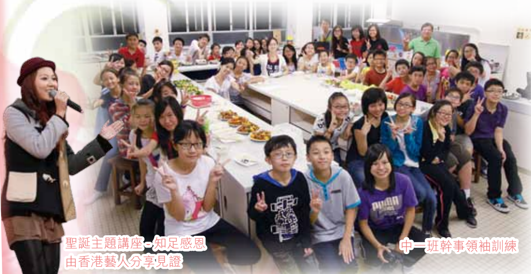
聖誕主題講座 - 知足感恩 由香港藝人分享見證