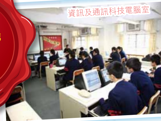
資訊及通訊科技電腦室