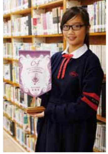
第64屆香港學校朗誦節中英文散文及詩詞獨誦1冠軍、1季軍及中英78優良。