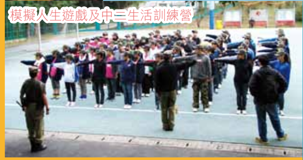
模擬人生遊戲及中三生活訓練營