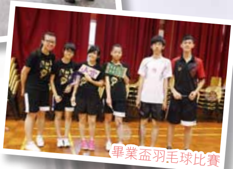
畢業盃羽毛球比賽