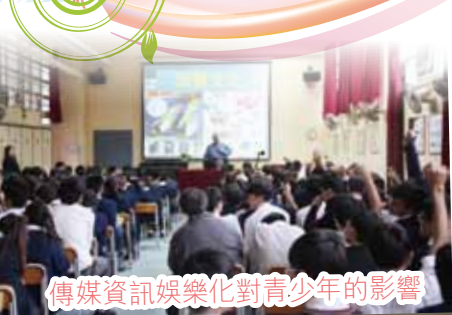
傳媒資訊娛樂化對青少年的影響