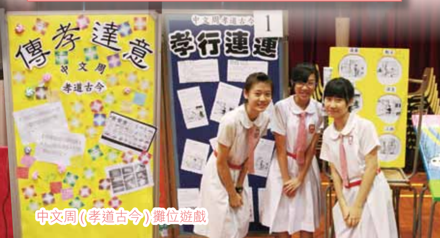
中文周(孝道古今)攤位遊戲