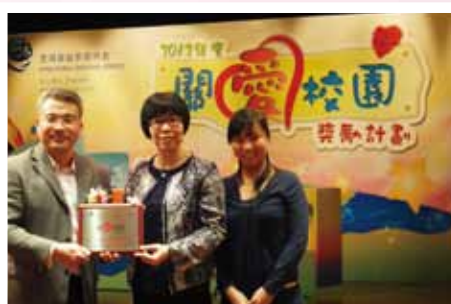
香港基督教服務處2012「關愛校園獎勵計劃」比賽「關愛校園」榮譽大獎