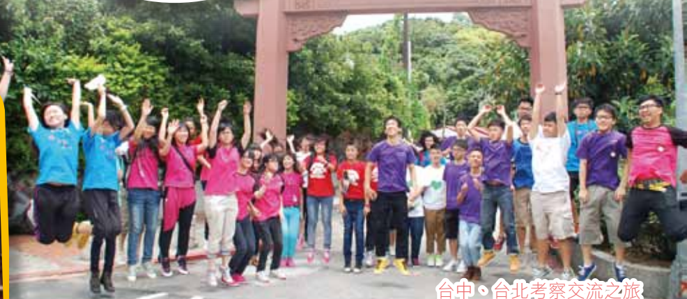
台中、台北考察交流之旅

香港學界體育聯會港九地域中學分會(第三組三區)男子1500米、5000米甲組冠軍、西貢區分齡田徑比賽2012青少年組(16-18歲)組1500米冠軍(破大會紀錄)