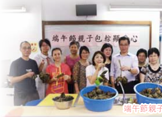
端午節親子包粽顯愛心