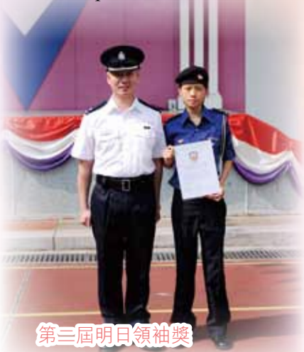
第三屆明日領袖獎

第 47 屆工展會全港中學生廣告短片創作比賽最佳短片大獎及「香港濟眾堂」體貼關懷大獎