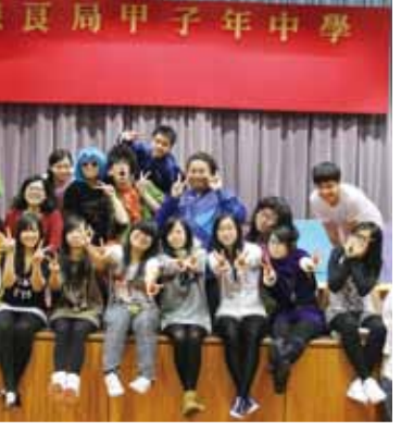
Hong Kong School Drama Festival 2011-12 Award for Outstanding Cooperation & Award for Outstanding Stage Effect