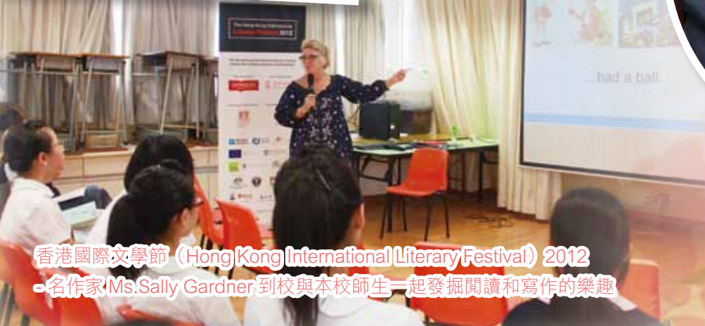
香港國際文學節 (Hong Kong International Literary Festival) 2012 -名作家 Ms. Sally Gardner 到校與本校師生一起發掘閱讀和寫作的樂趣