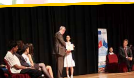
參加國際文學節 Hong Kong International Literary Festival