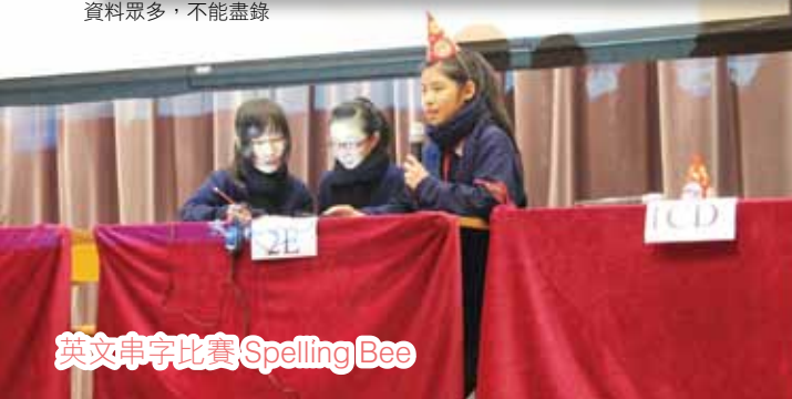
英文串字比賽 Spelling Bee