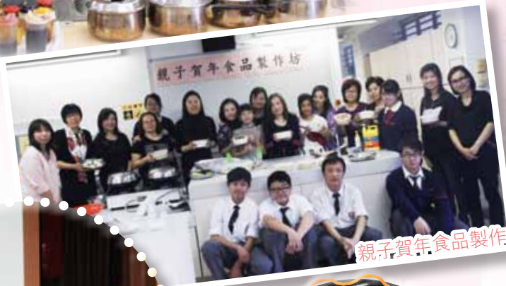
親子賀年食品製作