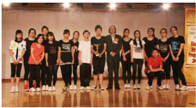
PLK Joint School English Drama Programme 2011-12 The Best Progress Award, The Outstanding Actor/Actress Award & Most Popular Performance.