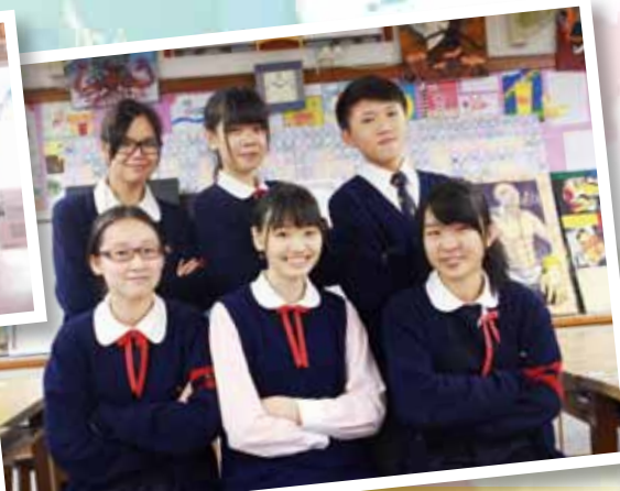
「十八區玩具形象DIY設計比賽」 全港第三名、西貢區優勝者。