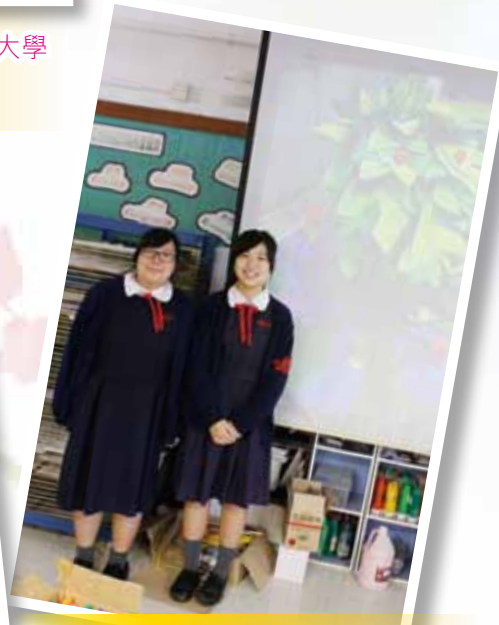
2012 國際合作社年美術設計創作比賽 - 世界賽區三等獎2名、香港賽區三等獎8名。