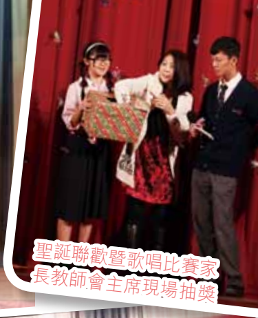
聖誕聯歡暨歌唱比賽家長教師會主席現場抽獎