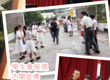
學生會候選內閣宣傳