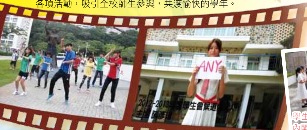
候選內閣自製宣傳短片。

學生會每年皆舉辦聖誕聯歡暨歌唱比賽。活動內容包括表演、抽獎、班際及個人歌唱比賽。學生會除負責籌備、宣傳及台前幕後之工作外，幹事們更會上台助慶表演，場面非常熱鬧。