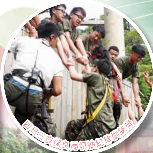
四月三夜保良局領袖紀律訓練營

香港學界體育聯會港九地域中學分會(第三組三區)男子1500米、5000米甲組冠軍、西貢區分齡田徑比賽2012青少年組(16-18歲)組1500米冠軍(破大會紀錄)