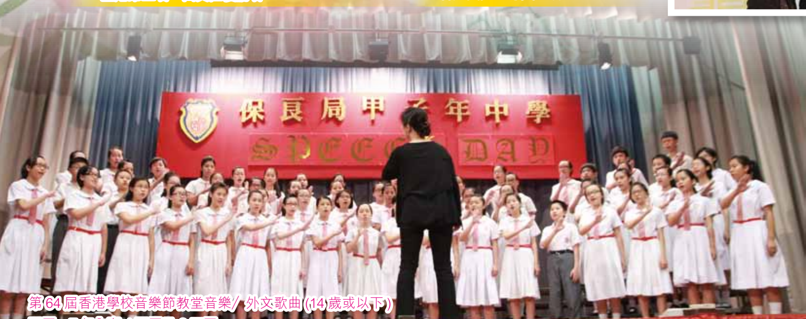
第64屆香港學校音樂節教堂音樂 / 外文歌曲 (14歲或以下) 冠軍。7年內奪4冠軍及3亞軍。