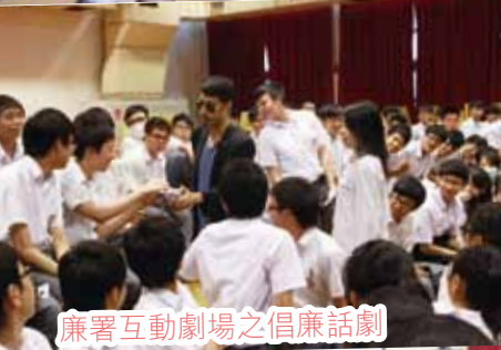
廉署互動劇場之倡廉話劇