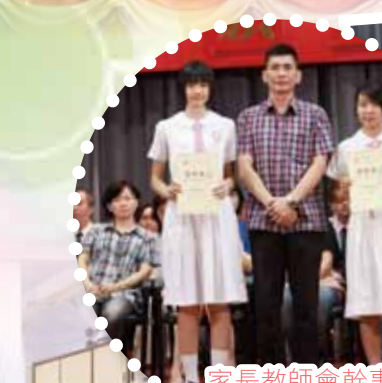
家長教師會幹事出席學期頒獎禮頒發學科獎