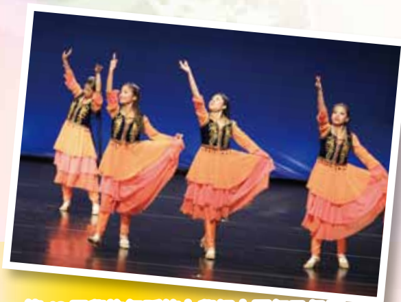
第49屆學校舞蹈節中學組中國舞乙級獎、第40屆全港公開舞蹈比賽公開組銅獎。