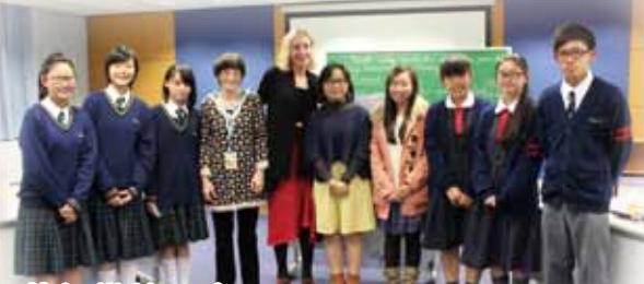
英語辯論比賽 (Inter-School NESTA-SCMP Debating Competition)

本校佔地甚廣，被翠綠山崗環抱，環境優美。本校共有四間電腦室，全校房間均設空調，大部分課室及專室均有投影機、電腦及實物投影機。更有寬敞之學生活動室，寧靜之音樂演藝室及藏書量豐富之圖書館，且有覆蓋全校之資訊網絡及數碼直播系，故本校堪稱設備完善。