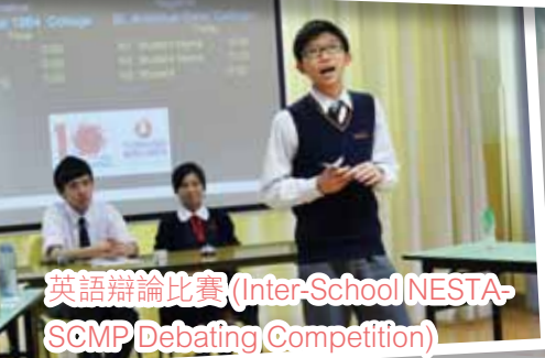
英語辯論比賽 (Inter-School NESTA-SCMP Debating Competition)