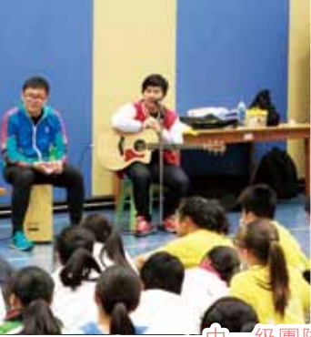
中一級團隊訓練生活營