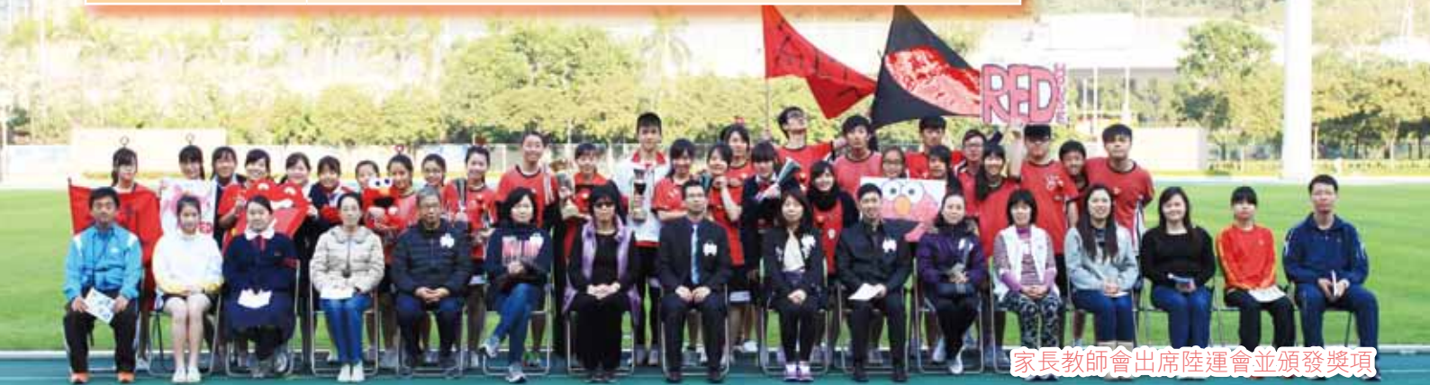
家長教師會出席陸運會並頒發獎項