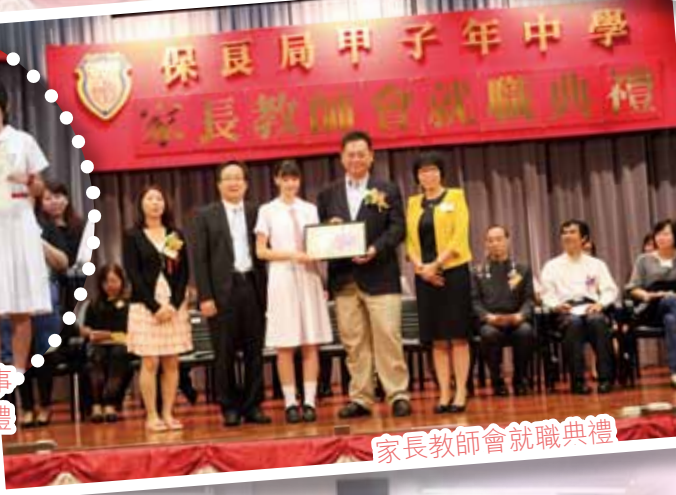
家長教師會就職典禮