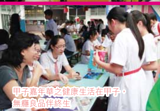
甲子嘉年華之健康生活 在甲子，無癮良品伴終生