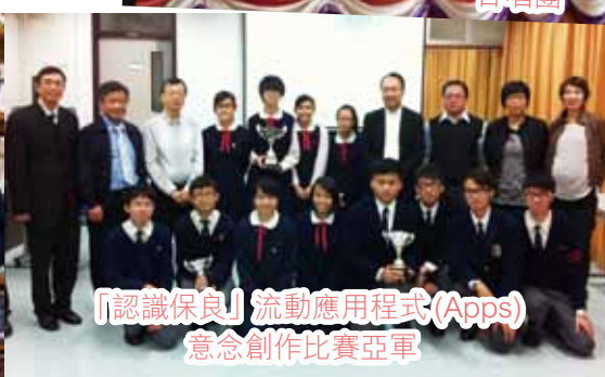
「認識保良」流動應用程式 (Apps) 意念創作比賽亞軍