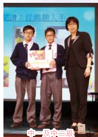
中一及中三級 中英文閱讀問答比賽