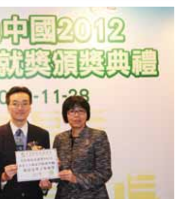
香港環境保護協會校際環保成就獎2012中學組香港十大綠色學校