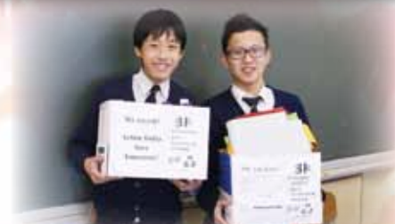
環保活動「做個綠色新人類」