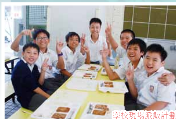
學校現場派飯計劃

本校參加由香港環境保護協會主辦的校際環保成就獎 2012，榮獲香港十大綠色學校（中學組）獎項。本校致力綠化校園，於校園建設甲子農莊，安排學生參與種植小組進行有機耕作。此外，本校積極推動環保服務學習，安排環保大使協助學校分類回收及於校內推展環保工作。本校亦推行一系列別具特色的環保活動，例如健康低碳飲食講座、美好環境郊野攝影比賽、無冷氣日、午膳時間熄燈一小時、一人一花活動等。在環保設備方面，本校除設立「環保節能實驗室」外，亦獲環境及自然保育基金資助近一百五十萬，於 2011 年 10 月正式進行現場派飯服務。本校積極推廣環保教育，盼能將環保意識植根學生心中。