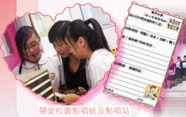
關愛校園點唱紙及點唱站