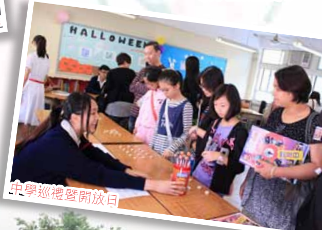
中學巡禮暨開放日