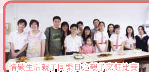
惜碳生活親子同樂日之親子烹飪比賽