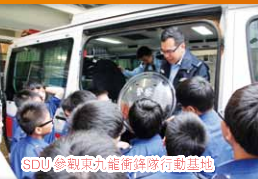
SDU 參觀東九龍衝鋒隊行動基地