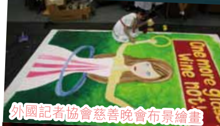
外國記者協會慈善晚會布景繪畫