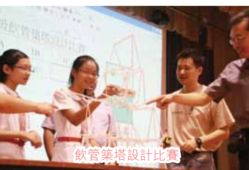
飲管築塔設計比賽