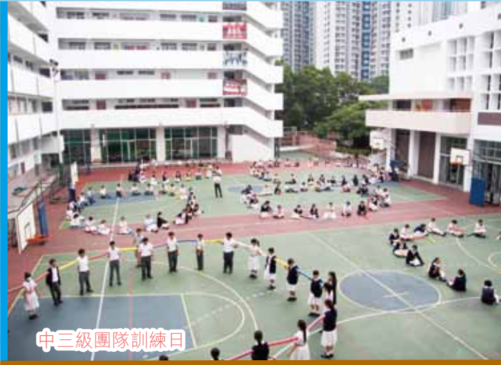
中三級團隊訓練日