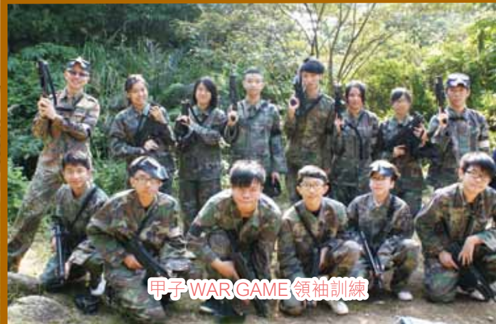
甲子 WARGAME 領袖訓練