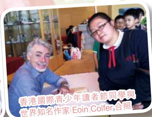
香港國際青少年讀者節同學與 世界知名作家 Eoin Colfer 合照